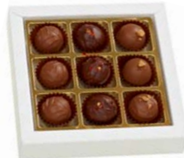
9er Sélection de Truffes Erlesene Truffes ohne Alkohol CHF 15.50