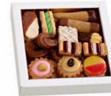
Wiener Konfekt Bestückt mit 15 Sorten süsser Versuchung 250 gr., CHF 22.50