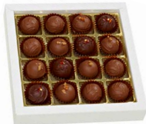
16er Sélection de Truffes Doppelrahm Caramel- und Chili-Truffes ohne Alkohol CHF 28.90