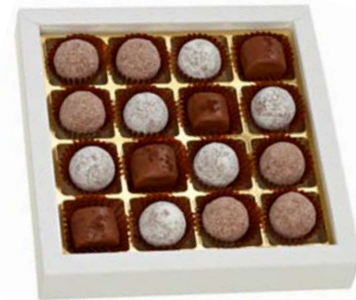
16er Truffes Eau de vie Baileys-, Champagner- und Amaretto-Truffes CHF 28.90