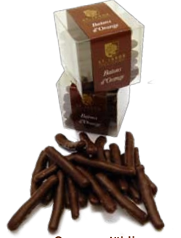
Orangenstäbli Mit zartbitter Couverture überzogen. 150 gr., CHF 9.40