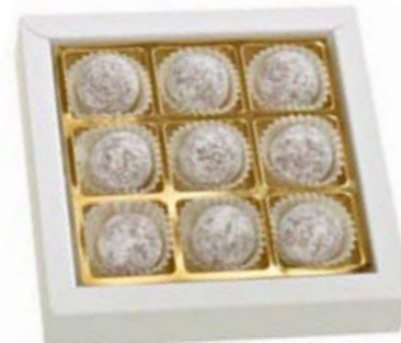
9er Truffes au Champagne Raffinierte Creation mit Marc de Champagne CHF 15.50