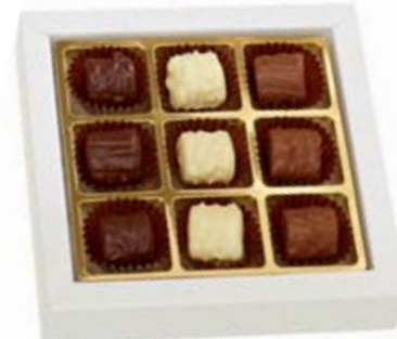
9er (ohne Alkohol) Truffes Tricolores CHF 15.50