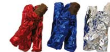
Branchli Milch, Vanille, Weiss 30 gr./Stk., Fr. 2.30