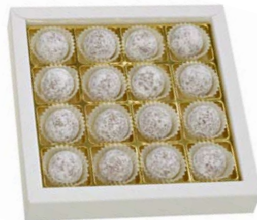
16er Truffes au Champagne Raffinierte Creation mit Marc de Champagne CHF 28.90