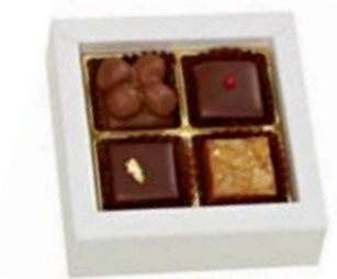
4er (gemischt) Sélection des Chocolatiers Feinste Pralinés ohne Alkohol CHF 8.80