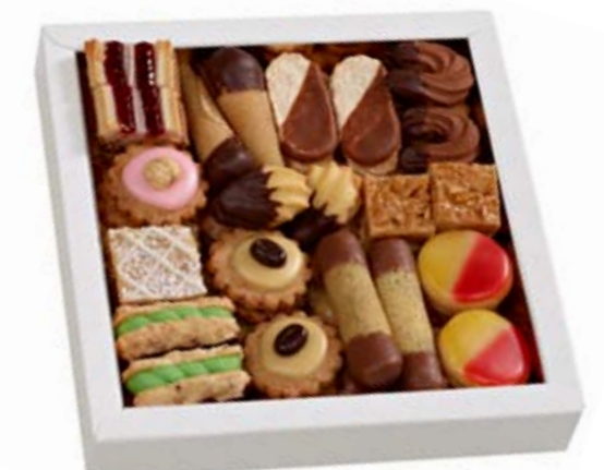
Wiener Konfekt Bestückt mit 15 Sorten süsser Versuchung. 400 gr., CHF 36.–