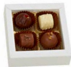
4er (ohne Alkohol) Sélection de Truffes Erlesene Truffes ohne Alkohol CHF 8.80