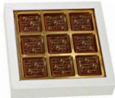
9er Carrés St. Jakob Zartschmelzender Haselnuss-Gianduja mit gerösteten Mandeln CHF 15.50