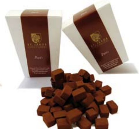
Pavé Grand Cru Couverture 65% gemischt mit zartschmelzender Pralinémasse 100 gr., CHF 11.90