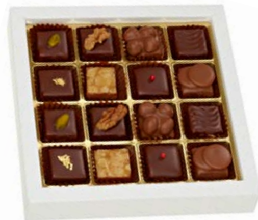
16er Sélection de Pralinés Edle Creation mit und ohne Alkohol CHF 28.90