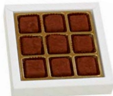
9er Grand Cru Maracaibo Bitterzart schmelzende Truffes mit 65% Cacao CHF 21.40