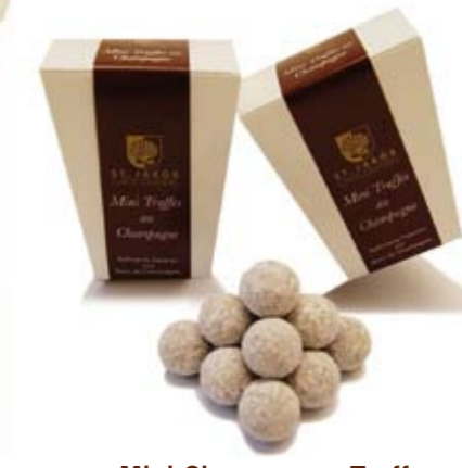
Mini Champagner Truffes Raffinierte Creation mit Marc de Champagne 20 Stk., CHF 15.90