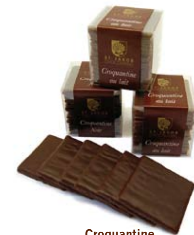
Croquantine Haselnuss-Gianduja-Waffelflocken mit Milch- oder dunkler Couverture überzogen. 11 Stk.. CHF 16.–

Die Verschmelzung von Tradition, Frische und Raffinesse entzückt jeden verwöhnten Gaumen.