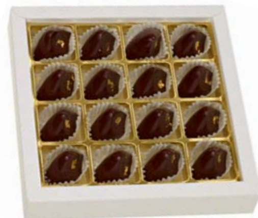
16er Grand Cru Nuggets Bitterzart schmelzende Grand Cru Venezuela-Pralinés mit einem Hauch Gold CHF 32.20