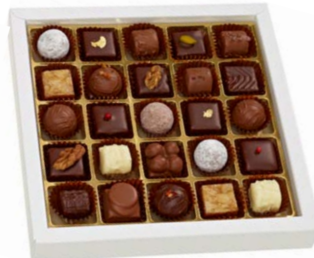
25er Sélection des Chocolatiers Feinste Truffes und Pralinés mit und ohne Alkohol CHF 39.80