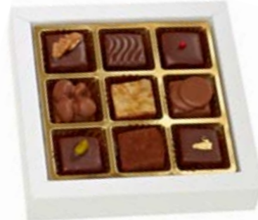
9er Sélection des Chocolatiers Feinste Pralinés mit und ohne Alkohol CHF 15.50