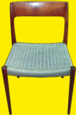
Treppmuster aus dänischer Flechtschnur.