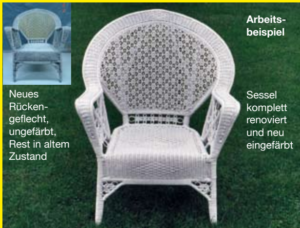
Sternengeflecht aus Stuhlflechtrohr, weiss lackiert

Stiftung St. Jakob Kanzleistrasse 18 CH-8026 Zürich Tel. 044 295 93 93 Fax 044 295 93 95