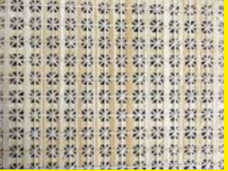
Sternengeflecht aus Rattan