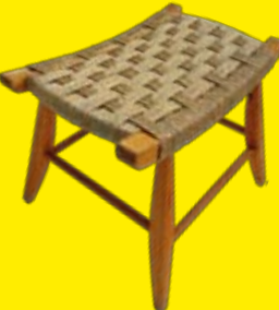
Schachbrettmuster aus Elhaschnur (Seegras)