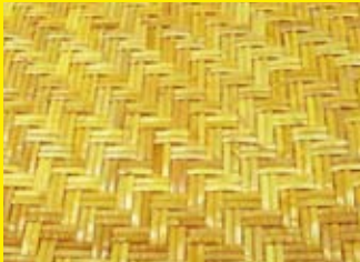
Parkettmuster-Geflecht/Glanschiene aus Rattan